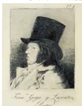
フランシスコ・デ・ゴヤ 版画集『気まぐれ』より《屏絵(自画像)》(前期展示)