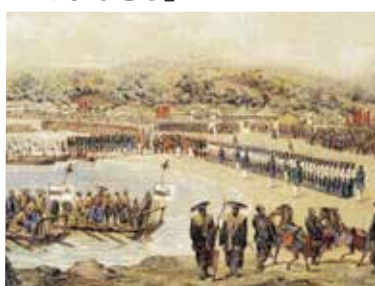
ヴィルヘルム・ハイネ《久里浜上陸》(部分)