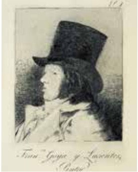
フランシスコ・デ・ゴヤ 版画集『気まぐれ』より《屏絵(自画像)》(前期展示)

コレクション展「ゴヤ版画『気まぐれ』『戦争の惨禍』」 ●期間:前期8月10日～9月8日○後期9月10日～10月20日 県 ☎0467(22)5000 休 月曜(8月12日は開館)