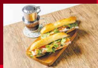
フォーやバインミーなどベトナムグルメを味わおう!

【上記記事に関する問合せ】 県国際課 ☎045 (285) 0761 FAX 045 (212) 2753