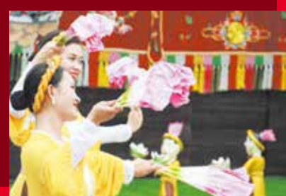
ベトナムの伝統芸能「水上人形劇」を鑑賞しよう!