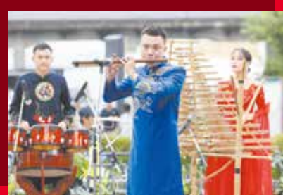
伝統舞踊や音楽など魅力あふれるベトナムの文化を間近で体感!