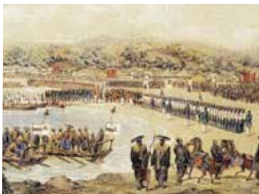
ヴィルヘルム・ハイネ《久里浜上陸》(部分)

●期間:8月10日～10月6日 県 ☎045(210)0926 休 月曜(8月12日は開館)、8月6日