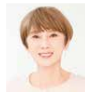
俳優 秋野 暢子さん