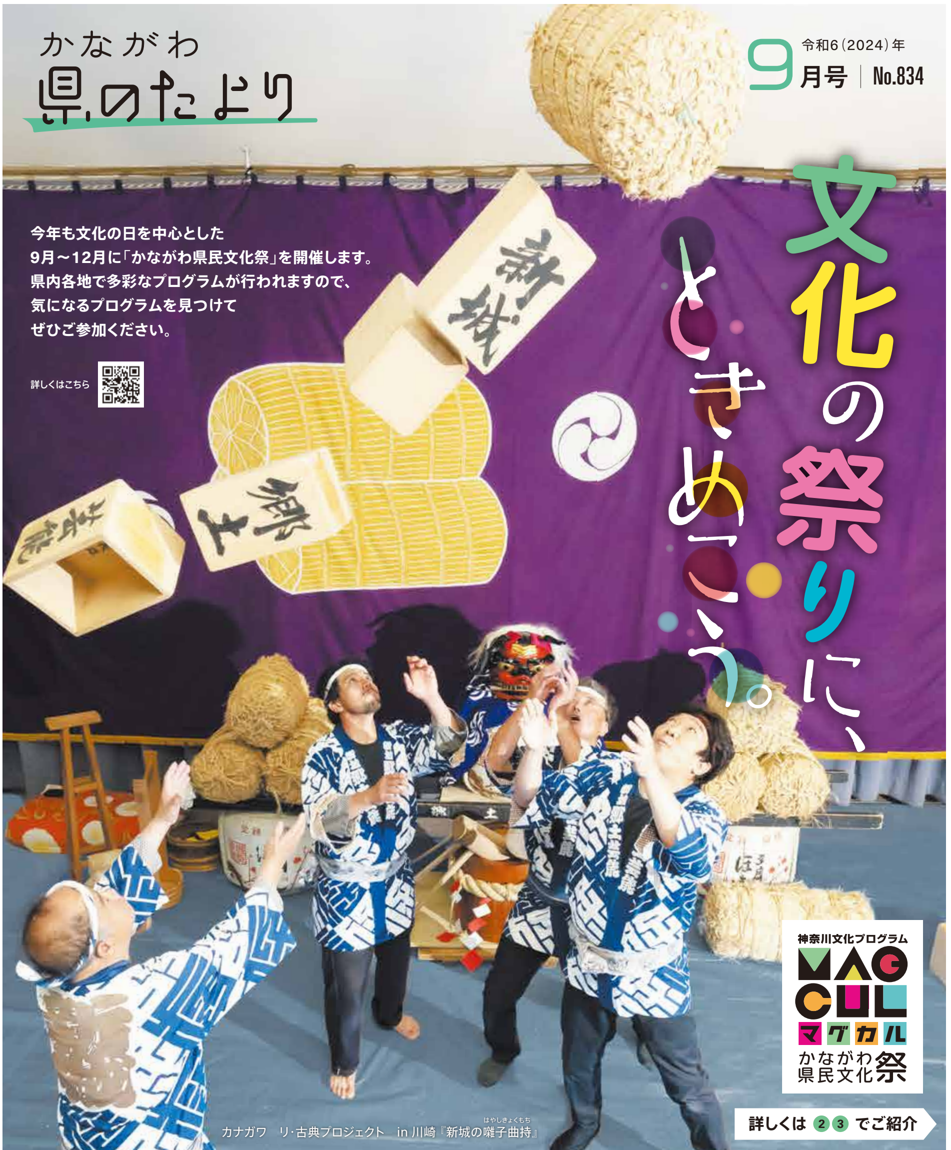
はやしきよもち カナガワ リ・古典プロジェクト in 川崎『新城の囃子曲持』