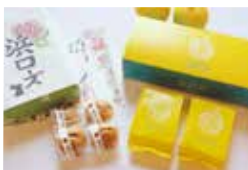
第30回各部門最優秀賞