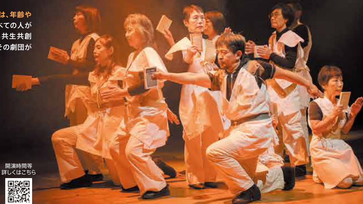
令和5年12月綾瀬シニア劇団第4回公演より