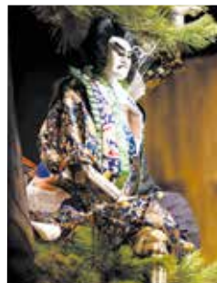
絵本太功記©青木信二