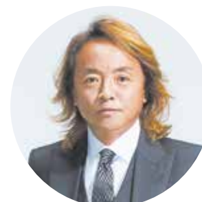
(一社)日本障がい者サッカー連盟会長 北澤 豪さん

[上記記事に関する問合せ] 県スポーツ課 ☎045(285)0796 FAX 045(662)5557