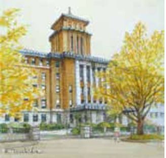
土田邦彦「60年の歳月(神奈川県庁本庁舎)」1988年