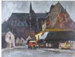
塚本茂(アミアン風景) 1965年 県立近代美術館蔵