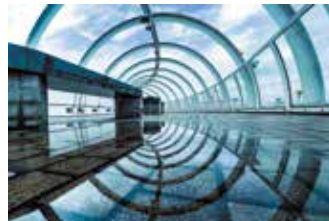
令和5年10月号掲載「異空間へ」