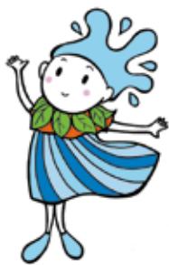
かながわ しずくちゃん