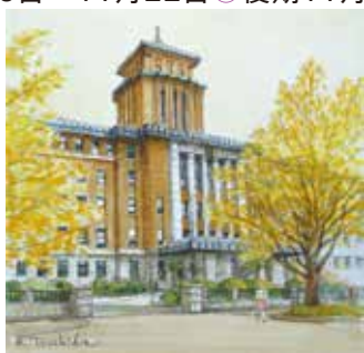
土田邦彦「60年の歳月(神奈川県庁本庁舎)」1988年