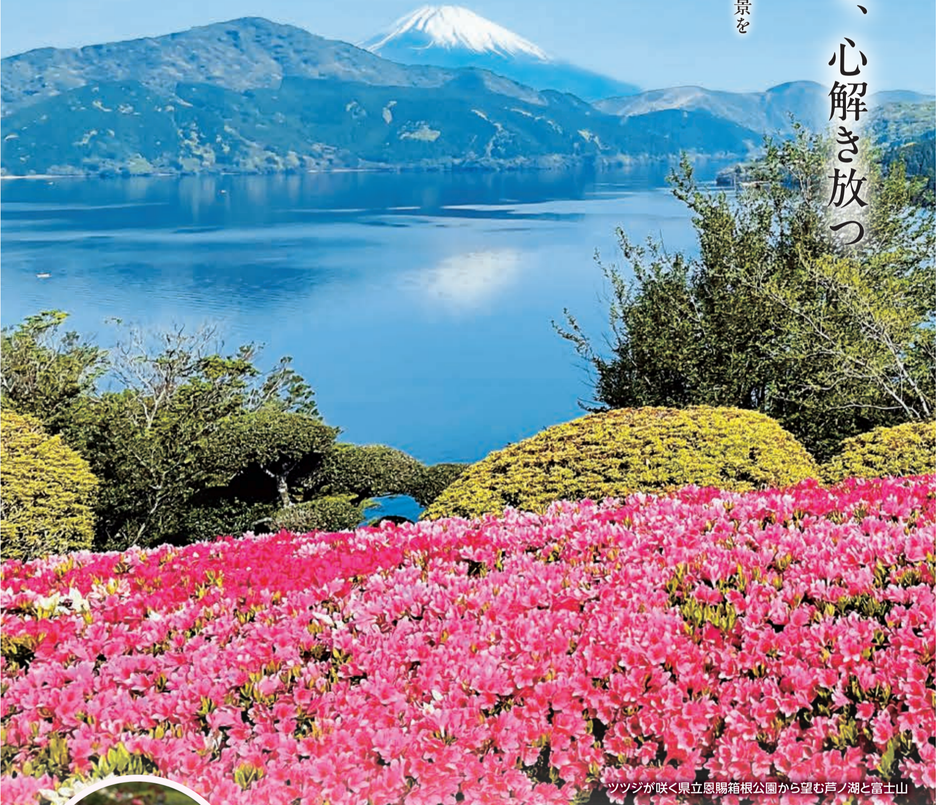
ツツジが咲く県立恩賜箱根公園から望む芦ノ湖と富士山