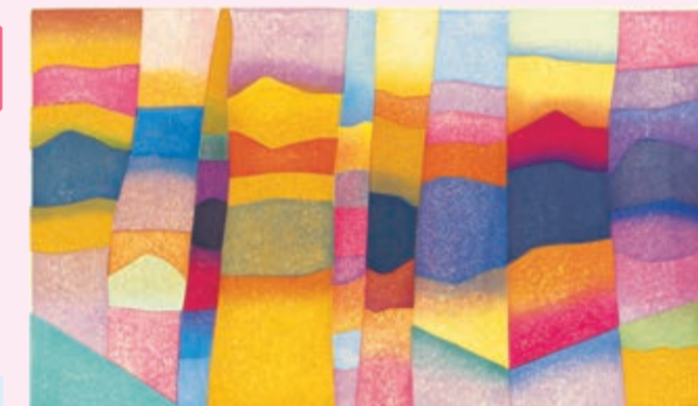
内間安理「Forest Byobu (Autumn-Stone)」1979年 個人蔵